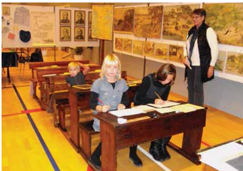
Undervisning af skolebørn på Historisk Messe i Haderslev 2010.

Da børn lettere lever sig ind i historien gennem udklædning, har vi fået den idé at fremstille fine hvide forklæder til piger og bondeskjorter til drenge, der besøger Skolemuseet. J.P. Nielsen Fonden har i denne sommer bevilget midler til indkøb af stof til disse formål samt til indkøb af børnebluser med vort logo til holdspil, bl.a. rundbold og håndbold, på museets boldbane.