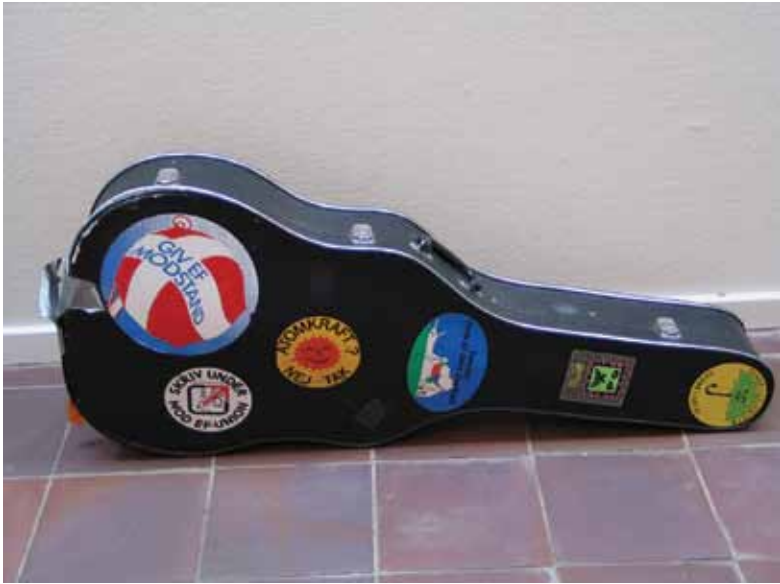
Guitarkasse, brugt af en seminarieelev i Tønder i 1970'erne. Kassen er prydet med kløbemærker fra tidens store mærkesager.