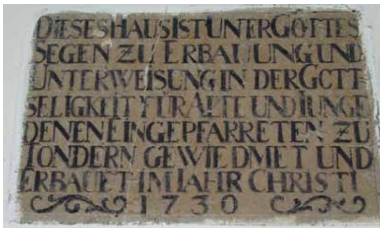
Indskrifttavlen fortæller om husets formål og byggeår.

indsamlet blandt Tønders borgere, og i 1730 stod Emmerske Bedehus klar til brug både som kirke og skole. Bygningen blev overdraget gratis til beboerne bortset fra den løbende vedligeholdelse samt præstens rejseudgifter fra og til Tønder. De skulle udredes af beboerne, og denne ordning ophørte først for 30-35 år siden.