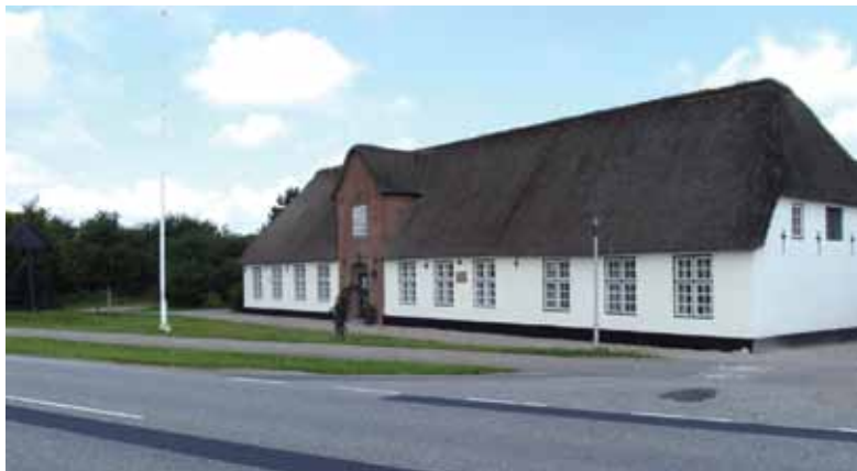
Den velholdte Emmerske Skole indgår i dag som en del af Emmerske Efterskole. Foto 2011.

Denne tid var også pietismens tid, hvor der blev lagt stor vægt på samfundets pligt til undervisning af børnene og indførelse i kristendommen. Herved opstod et behov for en skole i Tønder Landdistrikt. Penge blev